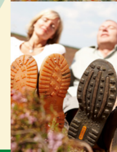
Motiv © Lüneburger Heide GmbH