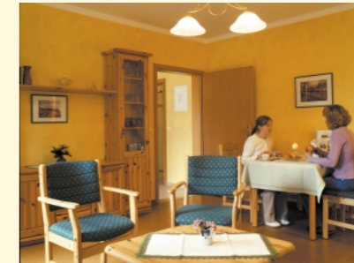
Wohnraum der Ferienwohnung