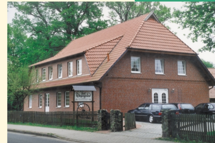
Im Gästehaus "Hof Wiesengrund", befinden sich 2 behagliche Ferienwohnungen im Erdgeschoss.

Für Reiter und Kutschenfahrer bieten wir 6 Gastpferdeboxen an.